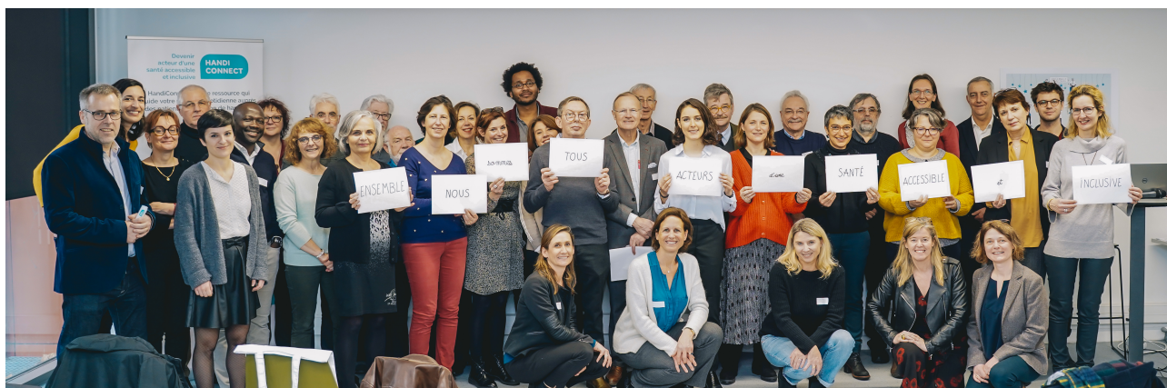
Les partenaires co-constructeurs de SantéBD et HandiConnect.fr

En lien avec le Ministère des solidarités et de la santé, CoActis Santé héberge aussi la banque d'expériences afin de promouvoir les initiatives de terrain et faciliter leur essaimage.